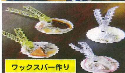
ワックスパー作り