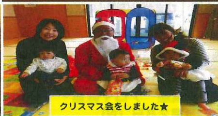
クリスマス会をしました★