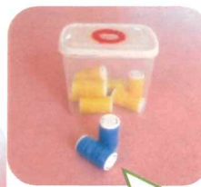
ふたで作るポットン おもちゃ