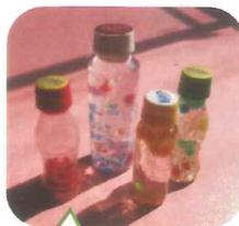
センサリーボトル

手作りおもちゃ講座 を行います。ペットボトルや牛乳パックなど身近なものを使って おもちゃを作る体験ができます。 予約が必要です 。事前にお問合せください。