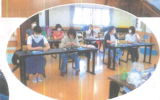
『メディカルアロマ講座』 蚊よけスプレー作りました