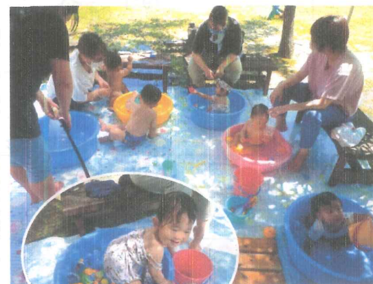
夏ならではの 水あそび(*^_^*)