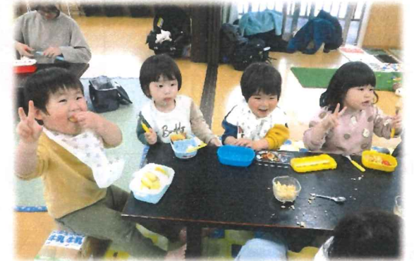
『お別れ会』楽しかったね！