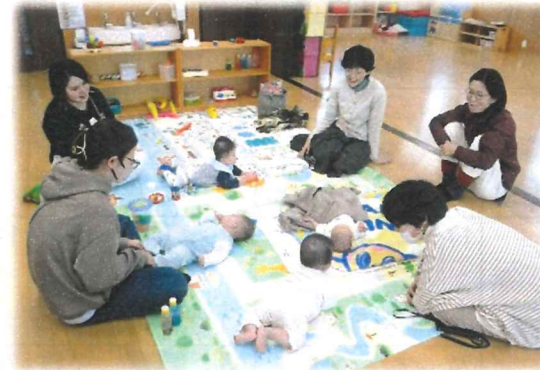
助産師さんも一緒にお話が広がりますよ！