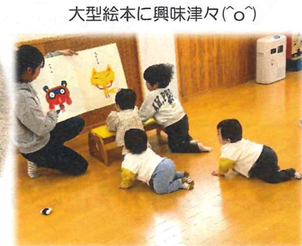
大型絵本に興味津々(〇)