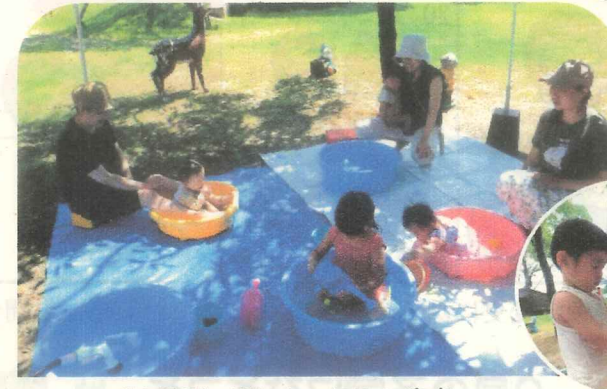
「水遊び」楽しかったね！(๑ˊᵒˋ)