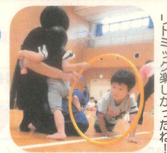
「なかよし広場」リトミック楽しかったね！