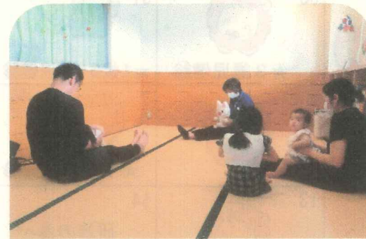
「おはなし会」がありました