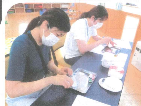
アロマ作りをしました