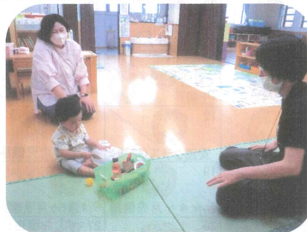
助産師さんとゆっくりとした時間を過ごせます