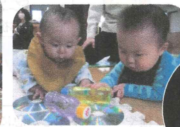
『センサーボトル作り』 子ども達のお気に入りです!!