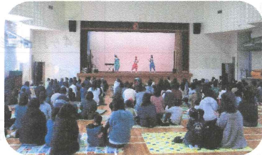
プッピーズさんと一緒に 『親子ふれあいコンサート』