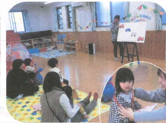
誕生日おめでとう!!