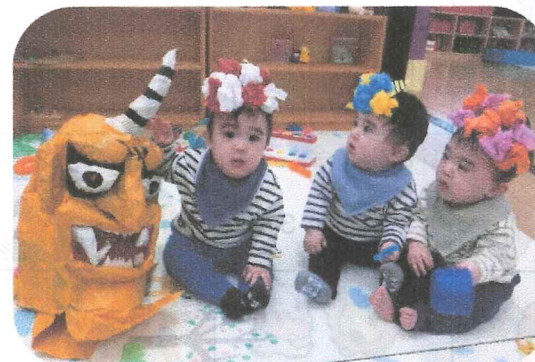
『節分』鬼は～そと福は～うちしたよ!!