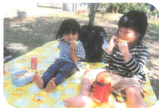
お外でお弁当タイム◎