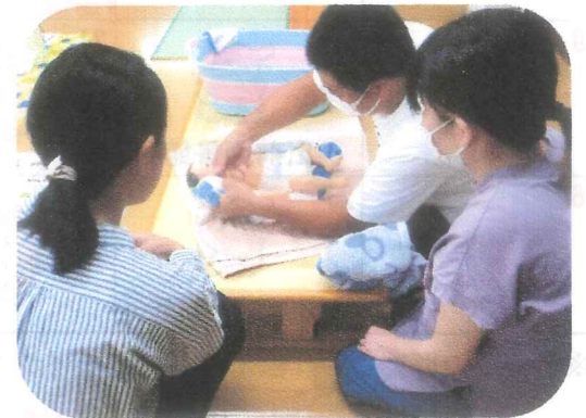
プレパパ・プレママデー 沐浴体験