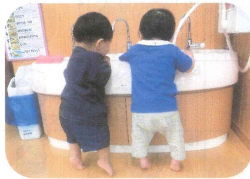
お水が大好き!! 水道でパチャパチャ!