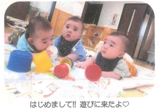
はじめまして!! 遊びに来たよ♡