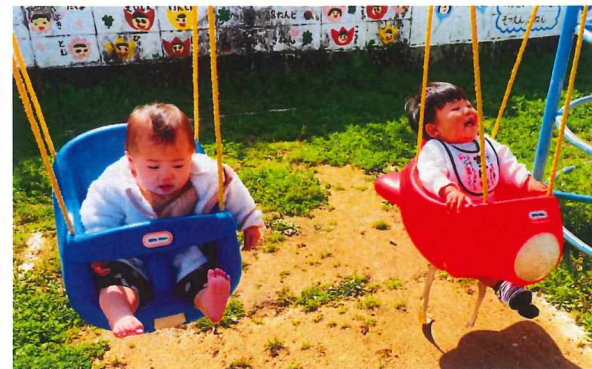
ふたりでなかよくブランコ♡楽しいね♡