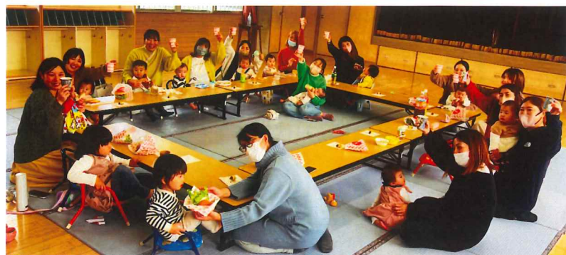
美味しそうなハンバーガー完成♡みんなでかんぱ〜い♡

子育て支援センターを巣立っても、ふあみりーDayを計画しますので遊びに来て下さいね♡ 再会できる場所を用意してお待ちしております♡