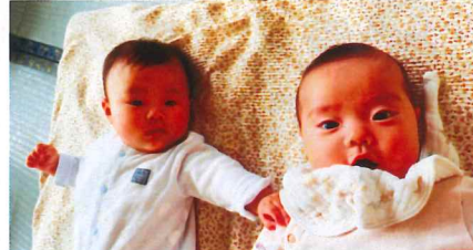
お友だちができたよ〜♡