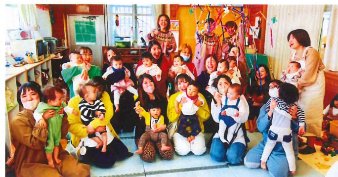
突然のクラッカー音！みんなの驚いた顔が最高♡