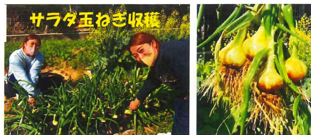
今年も支援センターの畑で、いろんな野菜を収穫して一緒にクッキングしましょうね♡