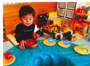
回転寿司いかがですか♡