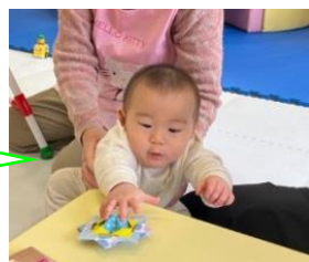
これはなんだろう？

どの色がきれいに見えるかな？と考え、3パターンを組み合わせコマを作りました。仕上がったコマが回ると、思わず手を伸ばし興味津々の様子でした