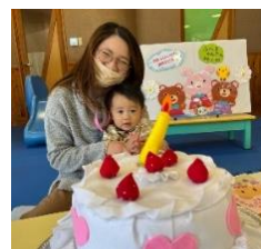
おたんじょうびおめでとう！

誕生会では、お話を聞いたり、歌を歌ったり、お祝いしました。プレゼントや、「おめでとう」の言葉や拍手をもらい、ニコニコでした。