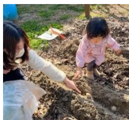
支援センターの様子

戸外に出るのが気持ちいい時期になりました。 支援センターの庭では、みんなで植えたチューリップやジャガイモの芽が大きくなってきました。春が来るのが楽しみです。 今年度も残りわずかとなりましたが、今月も楽しい講座を用意しています。ぜひ遊びにきてください。お待ちしております。