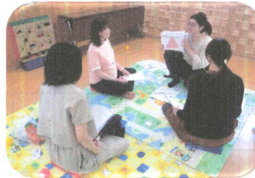
毎月『安産クラス』があります マタニティママも遊びに来てください