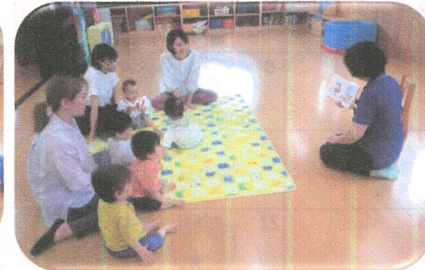
『出前図書館』絵本を見るの楽しいね