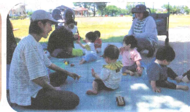
『イ草の里公園』日陰でお友達と心地良く遊んだよ