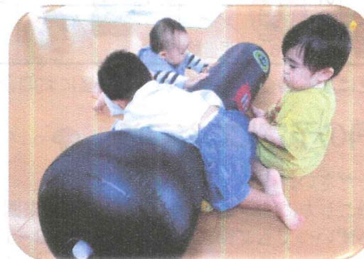
『ほっぺハウス』何だこれ!? おもしろいね