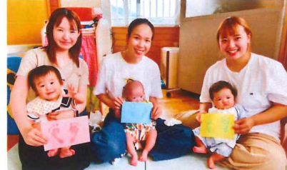
かわいい足型がとれたよ♡