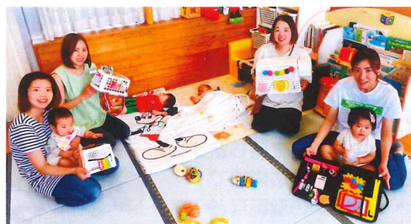
手作りビジーボード♡いっぱい遊んでね

9/12(木) 9/26(木)に、ママ企画自由製作の時間を計画しましたのでどうぞご利用ください♡次はどんなものができるのか楽しみにしています♡