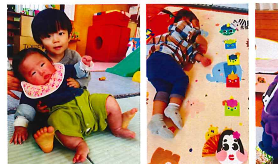
遊んで食べて眠って♡大きくなってね