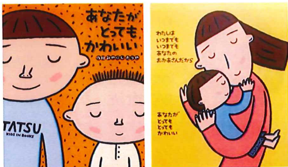
作・絵：みやにしたつや 出版社：金の星社