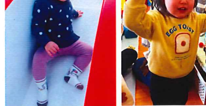
みんなと楽しいお弁当♡