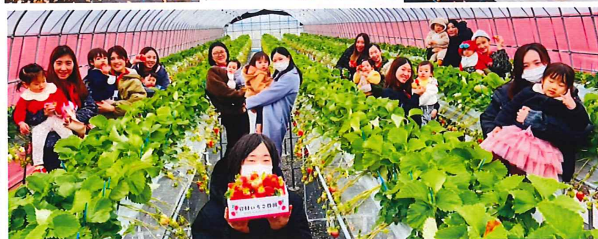
いちご何個食べれたかなあ～？みんなとお出かけ楽しかったね♡