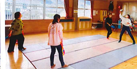
♡楽しかった羽根つき大会♡