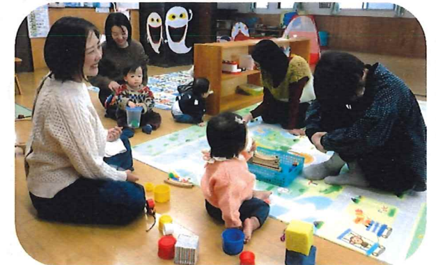
助産師さんとお話、楽しそうですよ!!