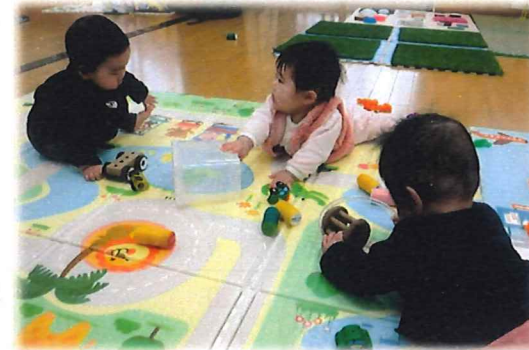
うつぶせ、ハイハイ上手になったね♡