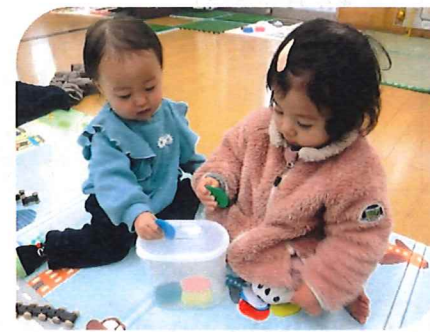
ボタンおとし上手になったね♡