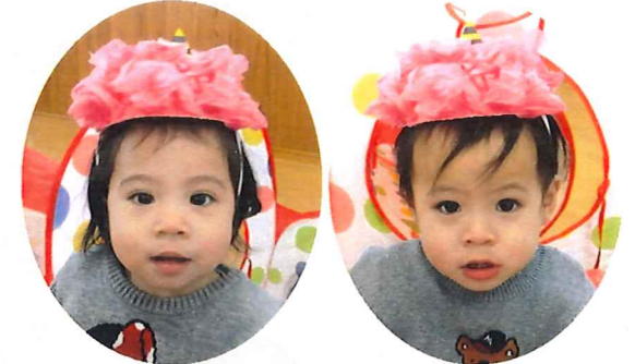
鬼さんの帽子かわいいね～