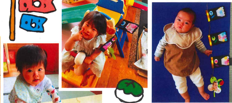
みんなすくすく育てね♡