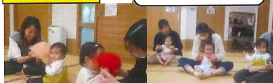
わらべうたを歌いながら、子ども達とふれあい遊び♪