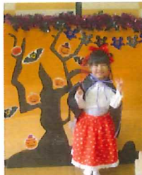
ハロウィンごっこ遊び☆