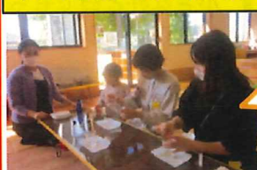
アロマ教室 リップ作り☆