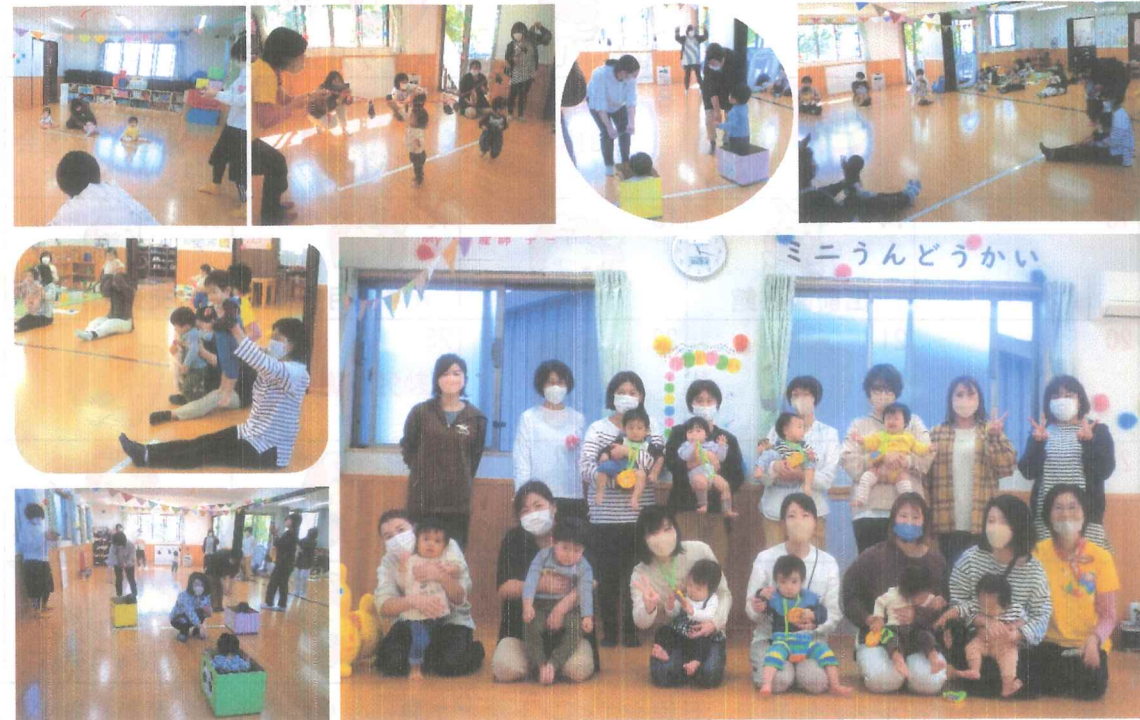
ミニ運動会をしました(〇) 泣いたり笑ったり、楽しい時間を過ごしました!!