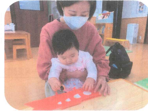
『こいのぼり作り』「こどもさんと一緒に楽しく作られています。」