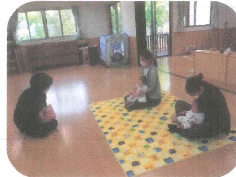
『出前図書館』「小さいお友達向けの絵本を読んでもくれます。」