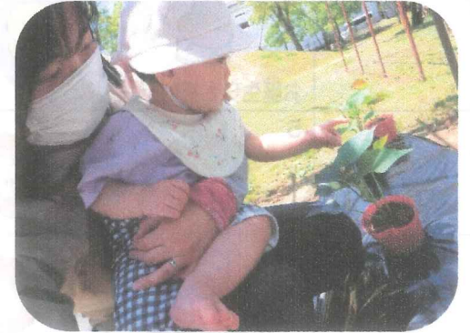
『芋の苗植え』「おいもさん、おおきくなつてねえ。」