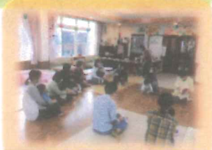
マタニティ smile ひろば 出産後のママたち参加 ハンドクリーム作りと おしゃべりタイムで癒し の間!!