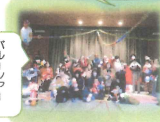
バルーン アート ショー