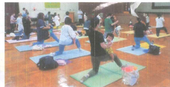
久しぶりのイベント 笑顔いっぱいみられました

暑い暑い夏がやって来ました。先月は、色々な楽しいイベントもあり、親子さんの笑顔をたくさん見ることができ、とても嬉しかったです!! 暑さに負けず、たくさん遊んで、いっぱい食べて、そしてしっかりと休息をとりながら、体の変化に気をつけつつ、暑い夏を元気に過ごしていきましょう♪ これからも、新型コロナウイルス感染防止対策をしっかり行い、子どもさんが安心して楽しく遊べる場を提供していきます。お出掛けの広場を控え、親子で安心して過ごせる場として「トマトのほっぺハウス」を提供したいと思います。遊びに来られた時には、体温を測っていただき、こまめに空気の入替えをしたりと、できる限りの対策をしていきます。新しい出会いを楽しみに、子育てを応援していきたいと思っています。