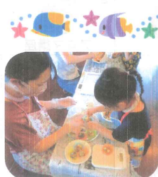
『みそ玉作り』 をしました