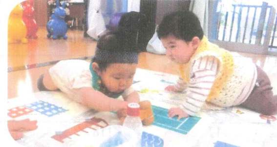
はじめまして(〇) いっしょにあそぼう!!