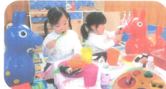
子ども達のあそびの発想が とてもステキです