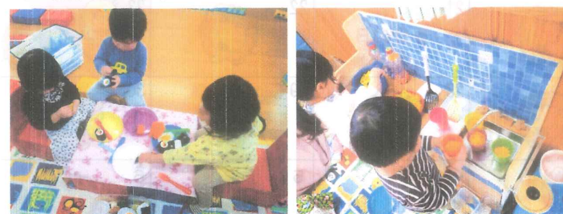
お友達のおままごと楽しんでます(^_^)