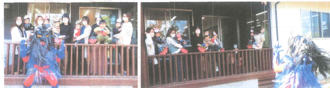
節分「おにはそとー！ふくはうちー！」豆まきをしました。こわーい鬼もやてきましたよー!!