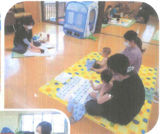
ベビーマッサージ きもちい〜い♪